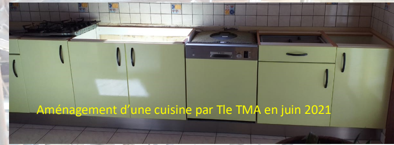
Aménagement d'une cuisine par Tle TMA en juin 2021

Trois spécialités sont accessibles par cette 2 nd e professionnelle